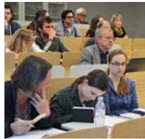
GV des Vereins grow am 1. November 2016

von Glycovaxyn AG. Glycovaxyn, eine der ersten grow Firmen, wurde 2015 erfolgreich an die britische Pharmafirma Glaxo-SmithKline, für insgesamt 212 Millionen US-Dollar, verkauft.