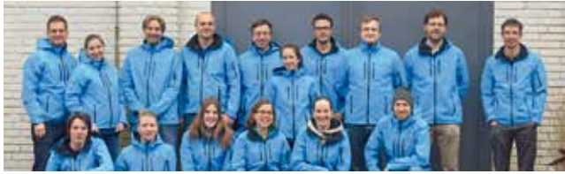
Das Team der Numab AG