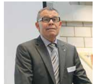
Ernst Stocker Regierungsrat Kanton Zürich